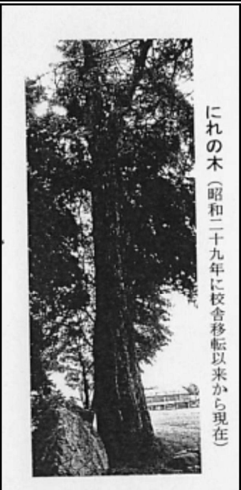
（同窓会）創立 50 周年記念より

そこで、子どもたちに全校朝会で愛称を募集することを伝えました。5つの案が出され、その中から投票で決めることにしました。投票の結果、「にれじいさん」に決まりました。私は「にーれちゃん」を推していたのですが、残念！でも、「にれじいさん」はとても親しみやすい呼び方になったと思います。皆さん、これからもよろしく！